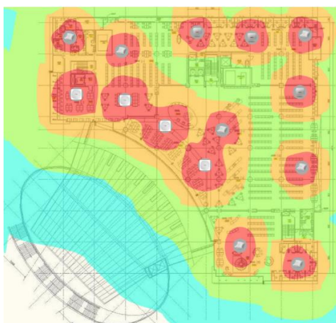
附圖一：圖書館五樓網路熱點圖(訊號強->弱，顏色為紅->黃->綠)。